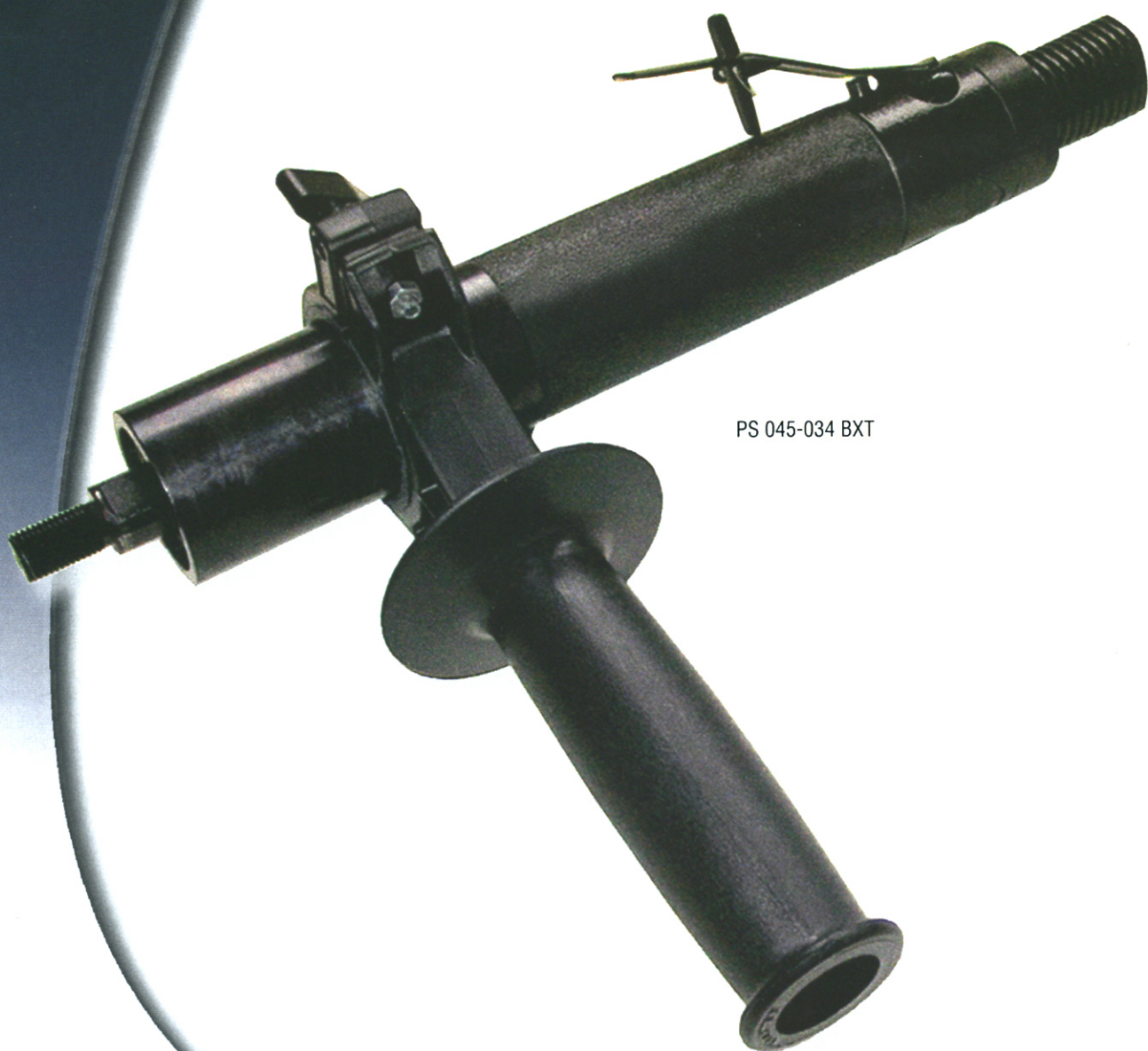
PS 045-034 BXT