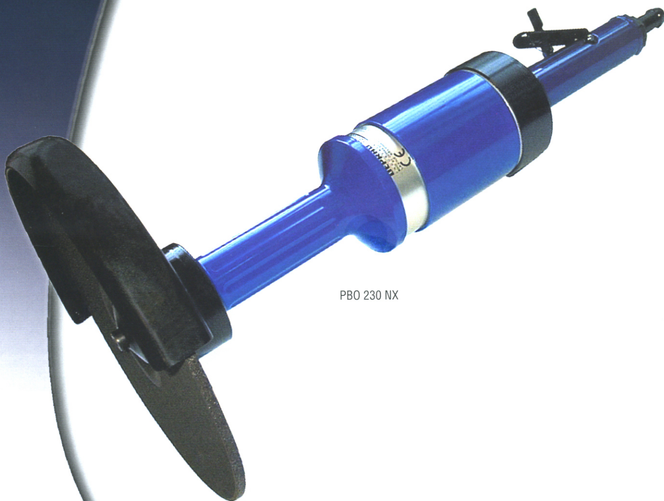
PBO 230 NX